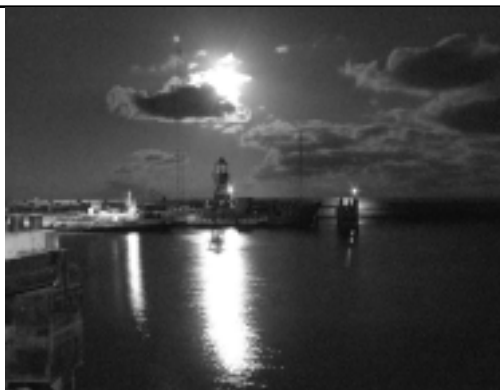
Lamp in de top van de zendmast

De afgelopen zomermaanden was het een drukte van jewelste. De jongens van Radio Seagull wilden immers allemaal eens een paar dagen aan boord vertoeven en bezetten zo de slaapgelegenheden. Met andere woorden, wij konden niet aan boord overnachten. Jammer, want we moesten dringend nog een aantal zaken afwerken. Maar goed, Parijs is ook niet in twee jaar tijd