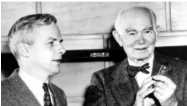
Rechts: Lee De Forest met in zijn hand de audion (1952)

WO 13 JAN: Vandaag is het precies honderd jaar geleden dat de eerste publieke radio-uitzending plaatsvond. Op 13 januari 1910 konden de bezoekers van een voorstelling van de Metropolitan Opera House live ook luisteren via radio-ontvangers. Ook op verschillende andere plekken in New York was dit het geval. Het was uitvinder en operaliefhebber Lee De Forest (1873-1961) die de experimentele uitzending verzorgde. Destijds beschikte nog niemand over een radiotoestel, maar op verschillende publieke plaatsen in New York waren ontvangers opgesteld waar de pers en het grote publiek de uitzending konden volgen. Ook op de schepen in de New Yorkse haven en in het laboratorium van Lee De Forest konden mensen meeluisteren naar de aria's van de Italiaanse tenor Enrico Caruso en de Tsjechische sopraan Emmy Destinn. Het experiment was niet echt een succes, want de zangers die op het podium stonden waren nauwelijks hoorbaar, maar het was wel de eerste live radio-uitzending ooit. De Forest was een van de pioniers op het vlak van radio- en elektronicatechnologie. Het was vooral zijn uitvinding van de radiolamp of de audion, een vacuüm buis die elektronische signalen versterkt, die hem bekend maakte.