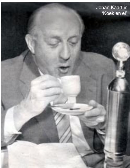
Johan Kaart in 'Koek en ei'