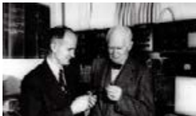
Dr. William Shockley (l) en Dr. Lee De Forest (r), 1952