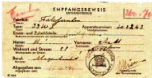
Ontvangstbewijs voor inbeslaggenomen radio