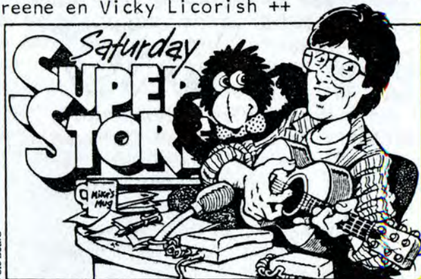
Bands, cartoons, competitions, prizes: Mike Read offers all BBC1, 9.0 am Saturday SuperStore