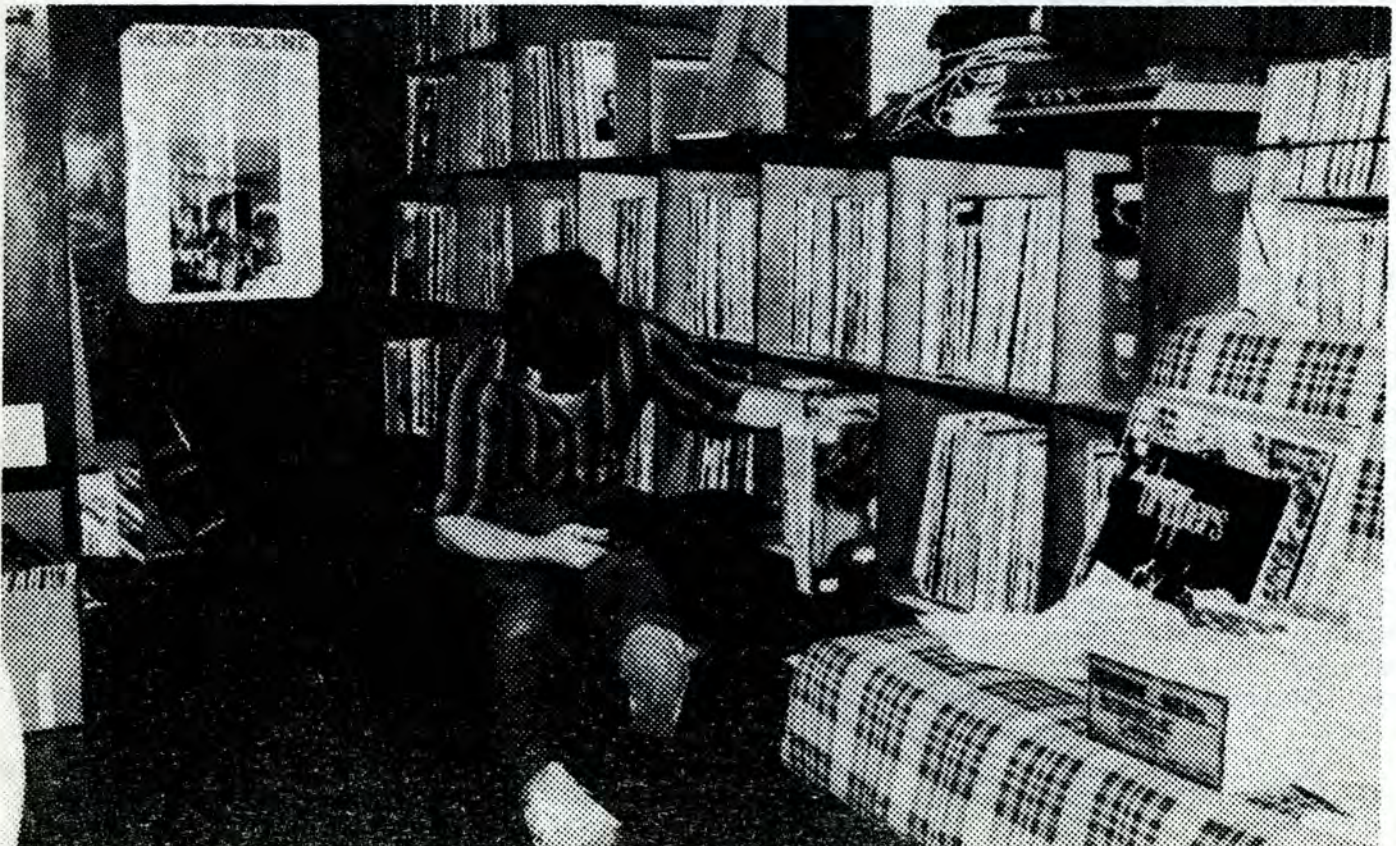
De discotheek aan boord van de Ross Revenge.